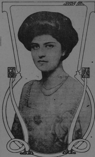
SRITA JESSIE WILSON, HIJA MENOR DEL PRESIDENTE DE LOS ESTADOS UNIDOS, QUE ES UNA FERVIENTE PARTIDARIA DEL FEMINISMO.